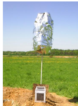
Конструкция «Супрематическое дерево», уничтоженная застройщиком

Малевича. Его лишают возможности зарабатывать на жизнь живописью. В поисках хоть какой работы он приезжает в Москву, останавливается в Немчиновке и пешком ходит на уже больных ногах (денег на транспорт не было) из Немчиновки в Москву. Питался порой лишь найденными в лесу грибами. Чтобы как-то прокормить семью, покупал нитки, отвозил их в Питер, где жили жена с дочкой. Они плели авоськи, и Казимир Северинович их продавал. Но болезнь, рак простаты, уже давал о себе знать, и тут все понимающие перекупщики и собиратели коллекций, словно опомнившись, начинают спешно покупать его картины за приличные деньги.