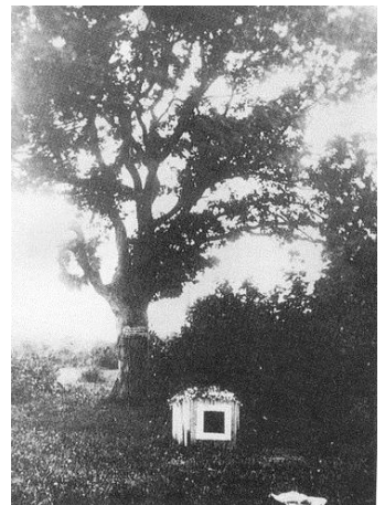
Дуб над могилой