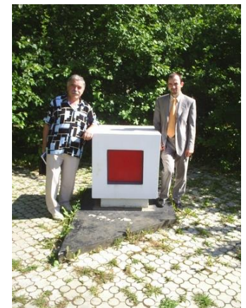
У памятного знака