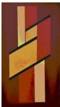
Построение 2011, х.м, 100x60