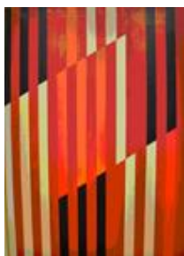
Конструкция солнечного дня 2007, х.м., 150x105