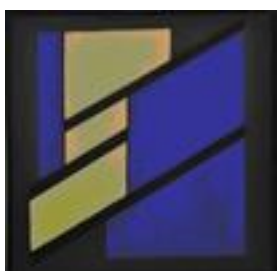
Воспоминание о Коктебеле, 2011, х.м., 73x73