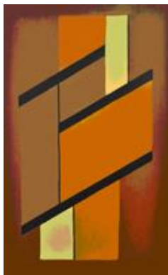
Построение 2009, х.м., 120x74