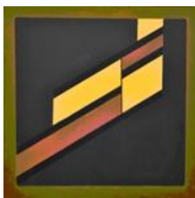
Построение 2011, х.м., 100x100